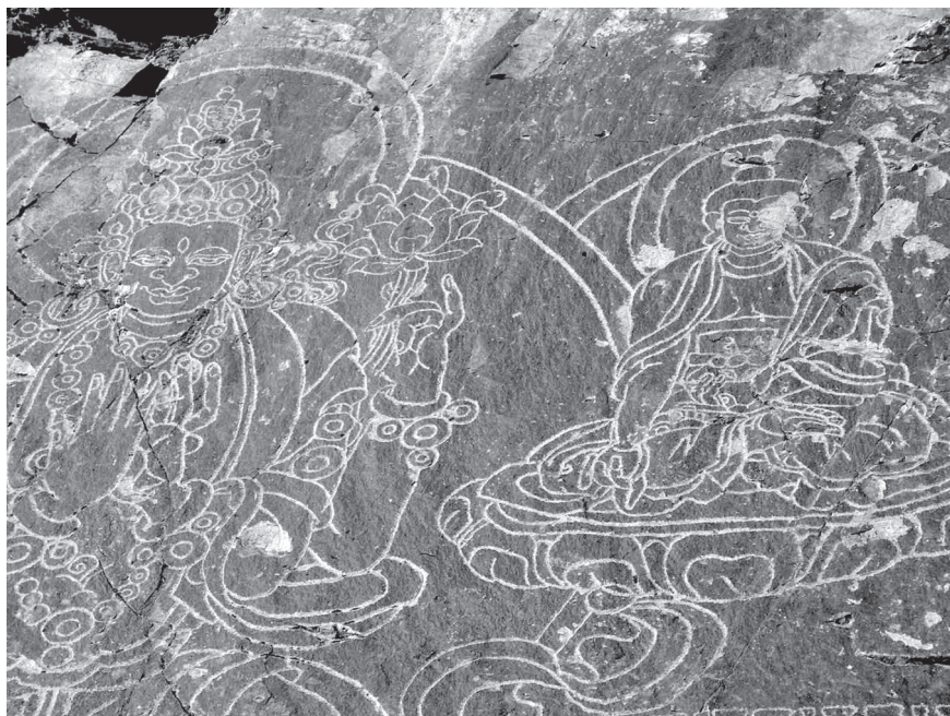
Изображение Будды. Тамгалы Тас. Алматинская область

В статье «О киргизских молах и древностях вообще», в первой своей статье по этой теме, он объясняет, почему встречаются большие по величине мазары: «Громадность у кайсака – первое условие величия предмета, и могилы больших форм поэтому устраиваются над прахом важных и богатых киргиз. Подобного рода могилы есть на татарском кладбище в Семипалатинске, в степи же они встречаются в Большой орде у подошвы обоих Алатау». Шокан приводит пример мазара Кулан-хана, указывая на то, что самой большой пантеон возведен на реке Талгар. Дает подробное описание: «Состоит из двух частей – ограды и самой гробницы. Ограда имеет вид кургана (крепостного сооружения с башенками на углах и с простым украшением над дверьми). Гробница стоит внутри ограды и имеет вид купола на кубическом пьедестале. Эта могила так обширна, что в ней могла бы поместиться вся ханская фамилия». Кулан-хан – султан Кулан,