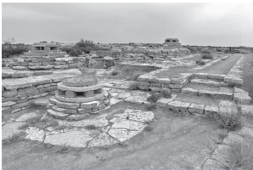
Подземная мечеть Султан-Эпе

Султан-эпе – сын известного поэта-мистика Хаким-ата (Сулеймана Бакыргани), который был учеником суфия Яссауи. Отец Султана-эпе не очень верил в необыкновенные качества сына, совершающего удивительные подвиги и чудеса. Люди же считали его покровителем рыбаков. Если тонущие произносили имя Султан-эпе, то откуда-то появлялся огромный шест, и люди спасались. Чтобы отец поверил в него, Султан-эпе даже перенес Каабу в Бакырган (Хорезм), оживил заколотых быков на глазах у отца, но отец продолжал недоверчиво