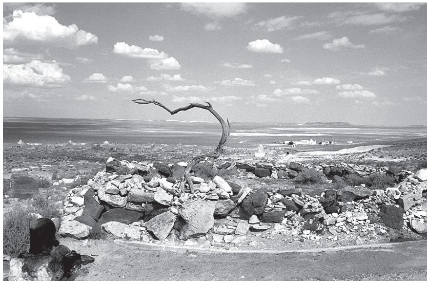
Некрополь и подземная мечеть Шопан-ата