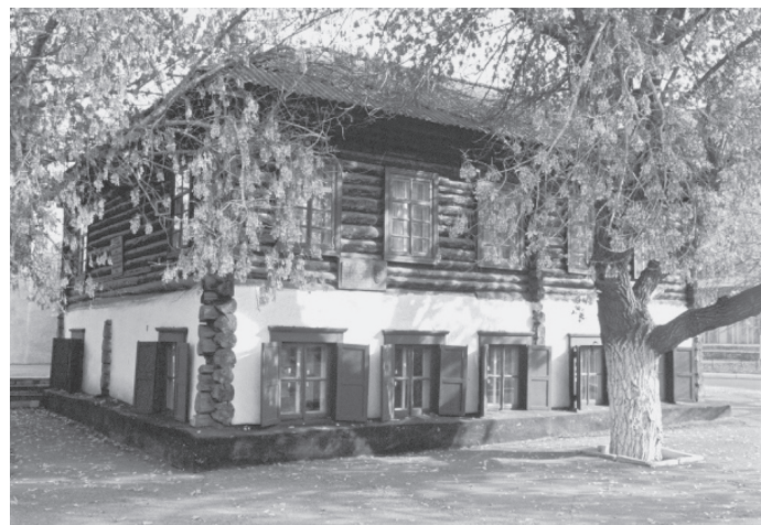
Дом-музей Ф. М. Достоевского

тогда ещё молодой журналист и стихотворец, опубликовал в областной газете «Прииртышская правда» хлёсткую заметку, где раскритиковал невнимание властей к знаменитому дому, состояние которого уже тогда оставляло желать лучшего. Понадобилось три десятка лет, чтобы ситуация кардинально поменялась. Свою роль сыграли неравнодуш-