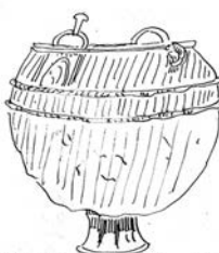
Общественно-торжественная Котла из Красной Бронзы. Вывезен из Минусинска. Ширина Тару, высота больше.

«Все потомки Чингис-хана называются тёрё», указывает время исполнения и место – 5 августа 1918 год, г. Омск. (По-видимому, встреча двух лидеров была вызвана необходимостью обсудить организационные вопросы только что создан-