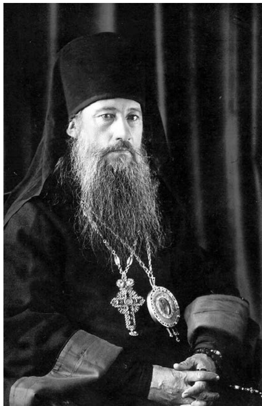
Священномученик Иаков (Маскаев).

Её отец, епископ Иаков, недолго прослужил в Осташкове. В 1930 году он был переведён викарием в Саратов, где его арестовали и отправили на три года в Соловецкий лагерь. Отбыв срок заключения, владыка Иаков получил назначение на Барнаульскую кафедру в качестве управляющего епархией, а также назначен временно исполнять обязанности епископа Бийского.