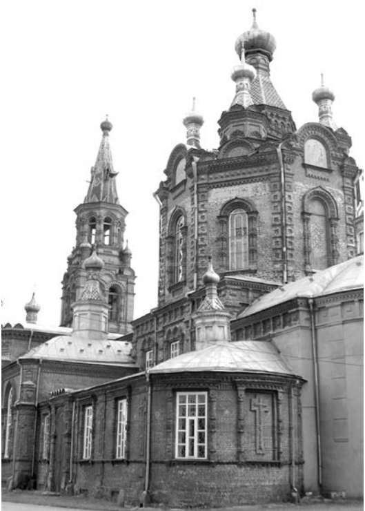
Вознесенский собор Знаменского монастыря.