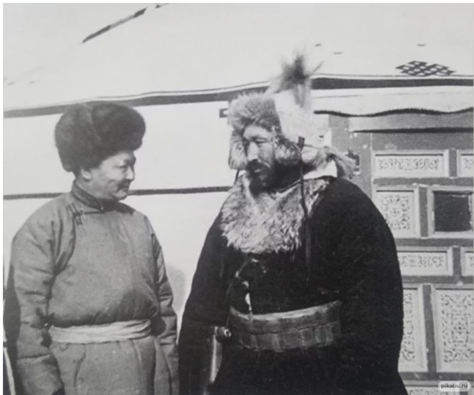
Маршал Х. Чойбалсан и Оспан-батыр. 1943 г.

Монголов представлял маршал Чойбалсан, глава коммунистической республики Внешняя Монголия. Двое представителей из СССР были высокопоставленными лицами из Казахстана. Всех троих сопровождала внушительная охрана, что, очевидно, отражало намерение поразить Оспан-батыра мощью и щедростью Советского Союза.