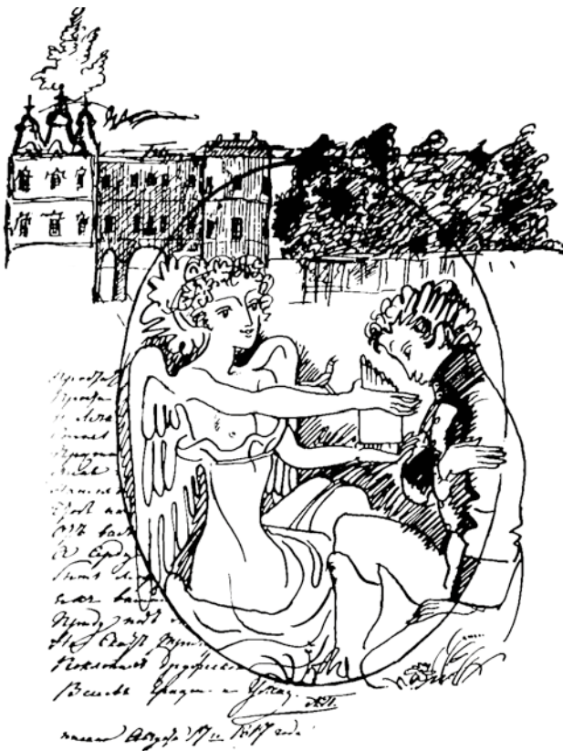
А. Гурьев. «Лирика Пушкина. Муза»

А в июне, шестого числа, к бюсту поэта, установленному около педагогического института, начинали подтягиваться люди. Сначала какие-нибудь начальники с казенными венками и казенными речами по бумажке, и пионерами, встававшими в почетный какой-то караул (чего они караулили, до сих пор не пойму!), потом приходили от каких-то организаций – с бумажными венками, но уже без речей, затем появлялись преподаватели пединститута, который тогда носил имя поэта; из скудной своей зарплаты они всегда вы-