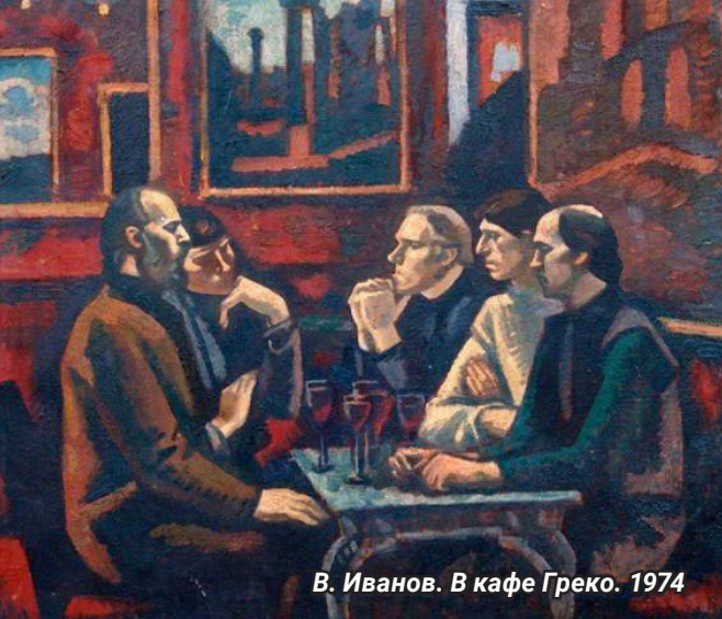
В. Иванов. В кафе Греко. 1974