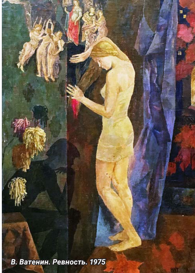
В. Ватенин. Ревность. 1975

Теченье дней, шелестенье лет, Туман, ветер и дождь. А в доме событие – страшнее нет: Из стенки вынули гвоздь.