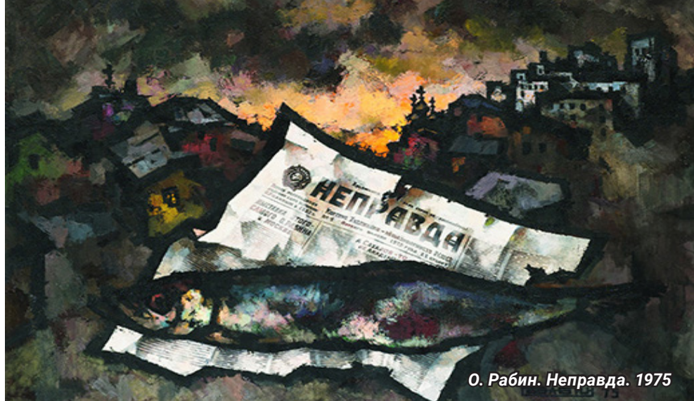
О. Рабин. Неправда. 1975