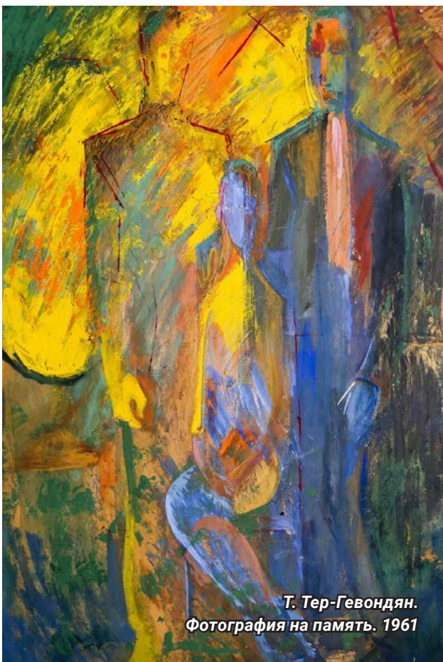
Т. Тер-Гевондян. Фотография на память. 1961

Туман, и ветер, и шум дождя, Теченье дней, шелестенье лет, Мне было довольно, что от гвоздя Остался маленький след.