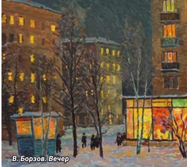
В. Борзов. Вечер