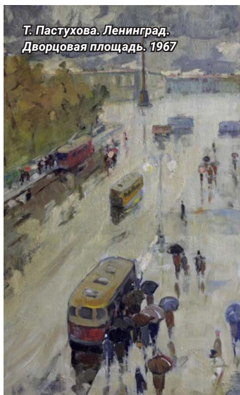
Т. Пастухова. Ленинград. Дворцовая площадь. 1967

Я пролетаю, Словно в планетарии, Огни мерцают, тайны отдают. Укутав ноги, женщины читают При свете ламп историю мою. Не всё бывает в жизни важно. Огни. На все пути молчат огни. Иллюминатор от тумана влажен, Растут, сливаясь, Частые огни.