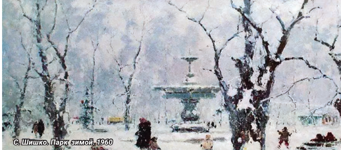
С. Шишко. Парк зимой. 1960