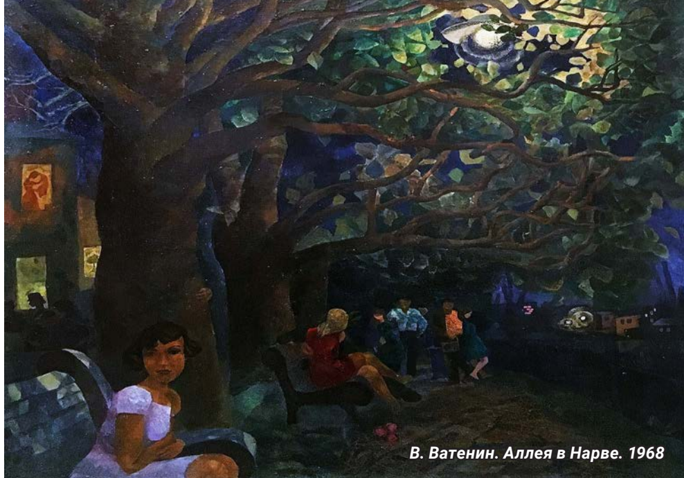
В. Ватенин. Аллея в Нарве. 1968