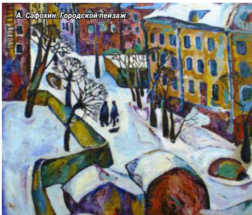
А. Саfoxин. Городской пейзаж