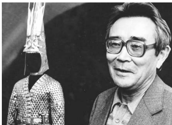
Археолог К. Акишев и Золотой человек

Что касается Золотого человека, то во время наших бесед Ноэль Жумабаевич рассказывал, что в 1970 году археологи во главе с Кемалем Акишевым пригласили его, чтобы показать разложенный на столе скелет Золотого человека уже после того, как у всех немного спало эмоциональное напряжение от неожиданного научного открытия и были решены организационные вопросы, связанные с найденными в захоронении золотыми украшениями. Попросили осмотреть череп, костные останки и сказать, можно ли провести антропологическую реконструкцию по методу Герасимова и соответствующие исследования скелета.