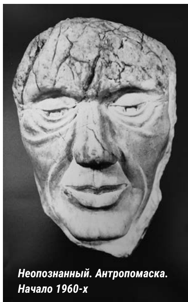
Неопознанный. Антропомаска. Начало 1960-х

Этот эксперимент вдохновил криминалистов, хотя сама методика восстановления, по словам самого Герасимова, находилась тогда еще в «зачаточном состоянии» и подвергалась научной критике со стороны академической науки. Зато криминалисты взяли тогда «метод