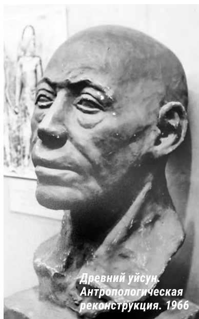
Древний уйсун. Антропологическая реконструкция. 1966