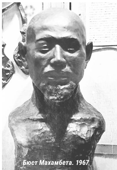
Бюст Махамбета. 1967