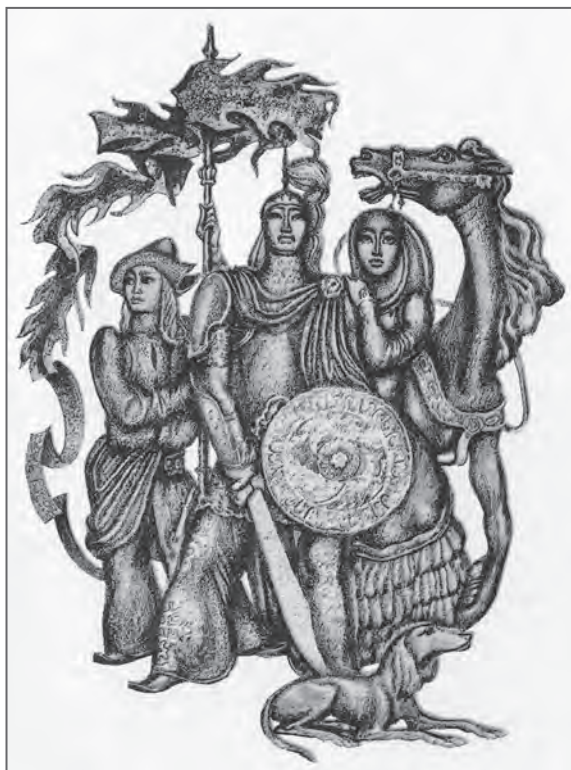
Е. Сидоркин. Алпамыс батыр